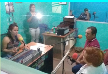
Copinula en el departamento de Ahuachapán. Compartimos historias y ideas para futuras colaboraciones.