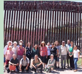
LOS PARTICIPANTES FUERON A VER EL MURO EN LA FRONTERA

gente que se ven obligadas a migrar a los EE.UU desde los países Centroamericanos como la represión del gobierno de Donald Trump tomando en cuenta la actualidad de El Salvador con la llegada del presidente Nayib Bukele, su Plan de Control Territorio y la represión a la juventud salvadoreña. La pobreza, violencia y falta de oportunidades siguen agudizando la migración y sus raíces vienen de las medidas neoliberales de un capitalismo que se profundiza mas en países empobrecidos. La Asamblea denunció como responsable al gobierno de los Estados Unidos que ha declarado la guerra a los migrantes que son ante todo seres humanos.